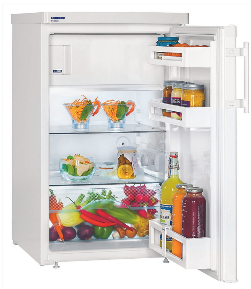
Table top 50 cm 4* Comfort