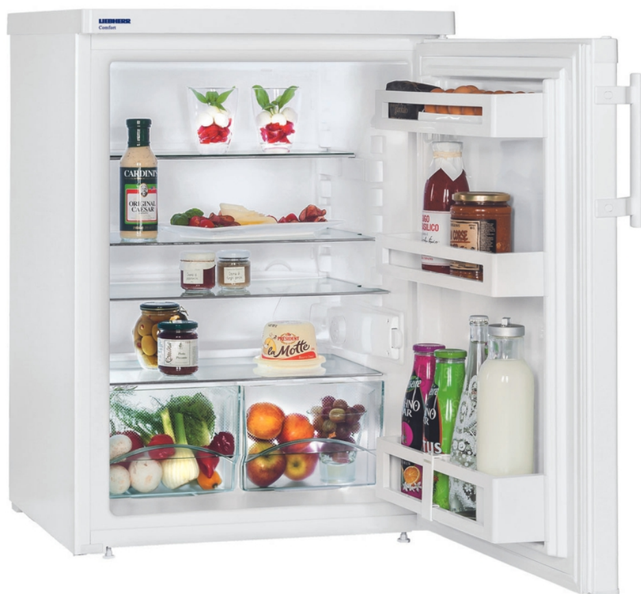
Table top 60 cm tout utile Comfort