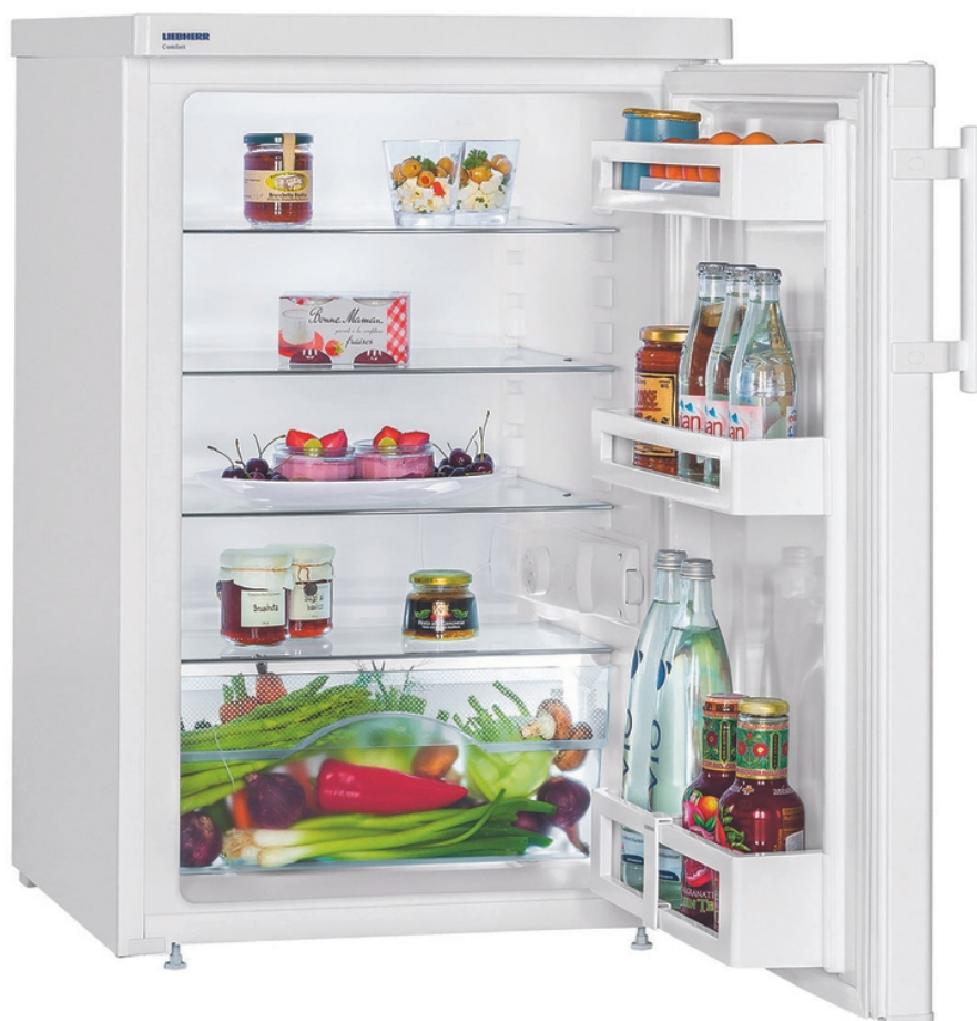
Table top 55 cm tout utile Comfort