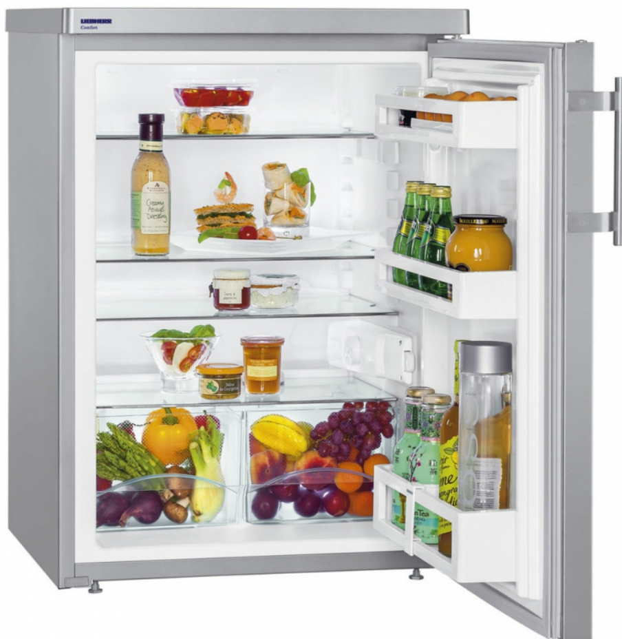
Table top 60 cm tout utile Inox Comfort