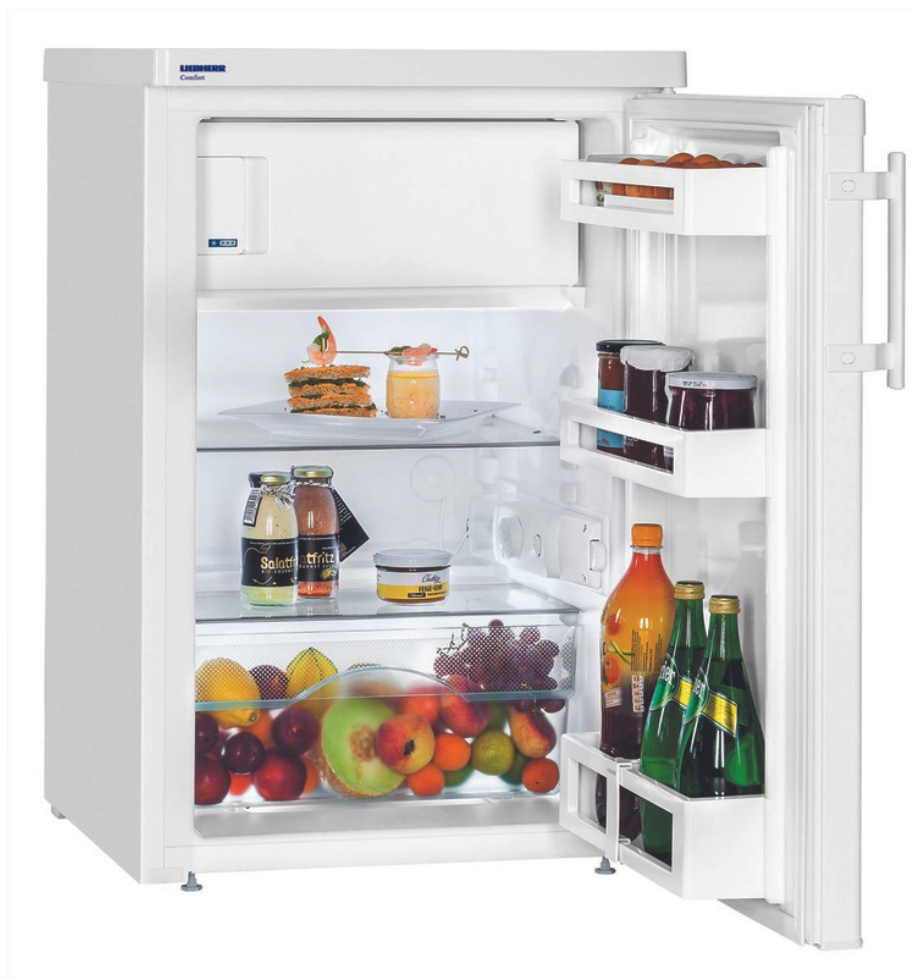
Table top 55 cm 4* Comfort