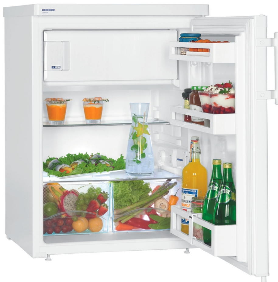
Table top 60 cm 4* Comfort